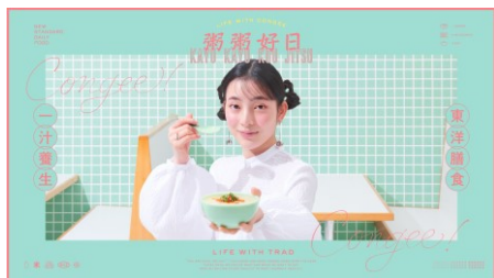
「粥粥好日®」 キービジュアル

Z世代の価値観を大切にしながら直接の対話を通して意見交換を行い、Z世代の持つ空気感や日常感、健康感を製品に組み込み、社外パートナーと協業し、スピーディーな製品開発・Z世代が自分らしくいられるライフスタイルブランド開発を行いました。発売に当たっては渋谷スクランブルスクエアでポップアップストアを展開するなど、リアルとSNSを融合させた新たなコミュニケーションスタイルを実施しました。